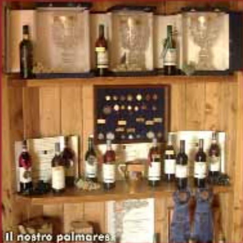
Il nostro palmares